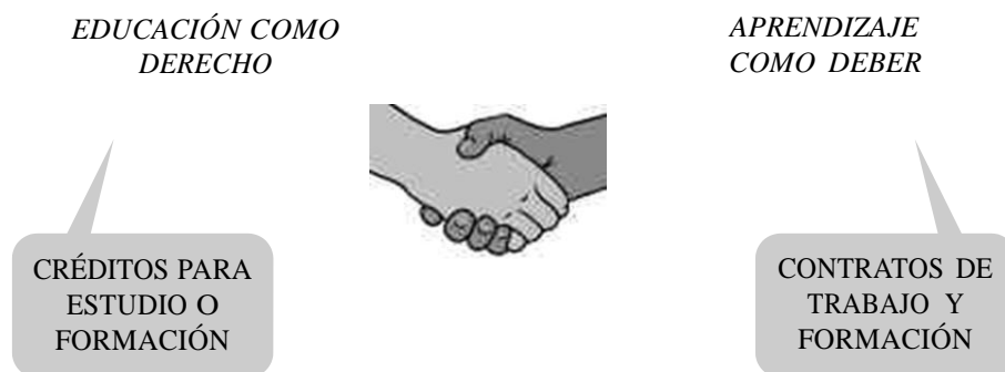
Figura 2. El nuevo contrato social: una nueva ciudadanía de derechos y deberes

Toda y cualquier colaboración socialmente densa y educacionalmente productiva se basa en un diálogo amplio y sin fronteras.